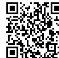
オープンデータ相談サイト