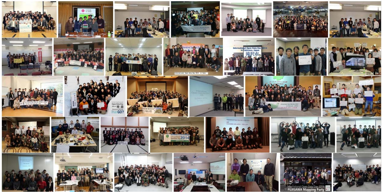
Open Knowledge Japan Flickr ページの画面キャプチャを加工